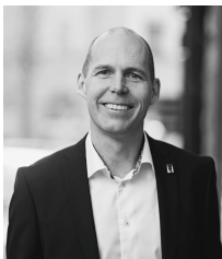
Förvaltare: Lars Bredenberg